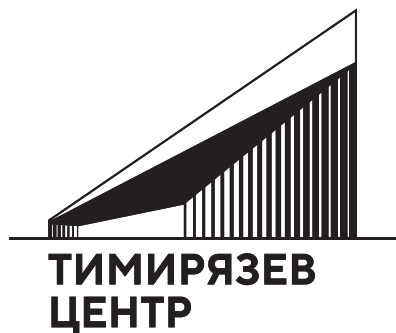
Логотип на белом фоне