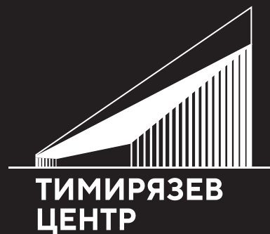
Логотип на чёрном фоне